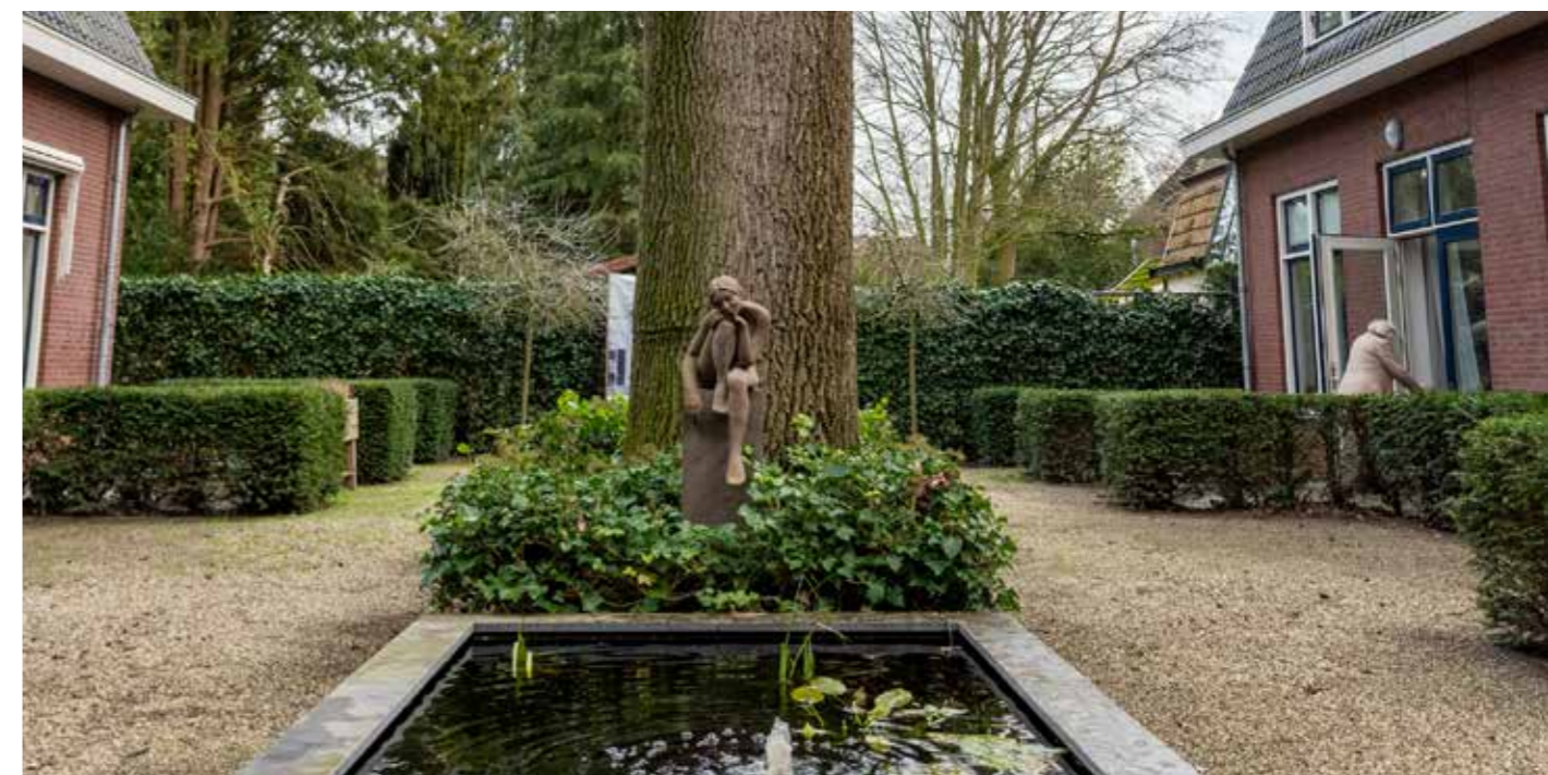
Zelhem (NL) | De Gouden Leeuw Zelhem