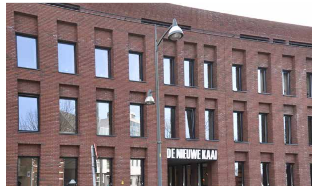
Turnhout (BE) | De Nieuwe Kaai

Na de openbare aanbieding tot inschrijving op nieuwe aandelen en de succesvolle private plaatsing van scrips kondigde de Vennootschap op 20 januari 2023 aan dat bestaande aandeelhouders en nieuwe investeerders ingeschreven hebben op 100% van de aangeboden nieuwe aandelen voor een brutobedrag van € 110.966.496 waarvan € 55.016.264 werd toegewezen aan de post kapitaal en € 55.950.232 aan de post uitgiftepremies. Na deze verrichting wordt het kapitaal van de Vennootschap vertegenwoordigd door 36.988.833 volledig volgestorte aandelen.